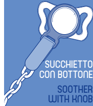
SUCCHIETTO CON BOTTONI SOOTHER WITH KNOB