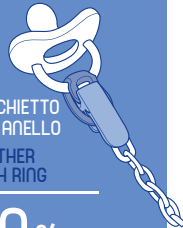
SUCCHIETTO CON ANELLO SOOTHER WITH RING