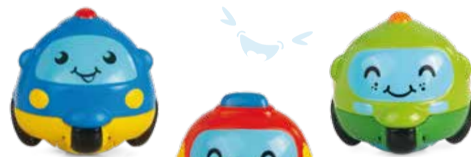
Peter the Police Car