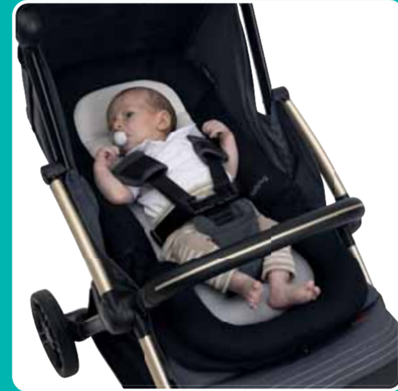
0 - 3 MONTHS