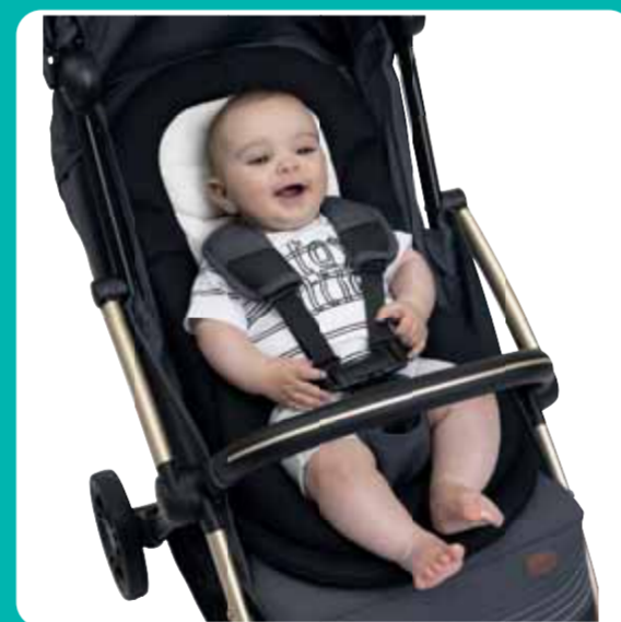
FROM 3 MONTHS

IL RIDUTTORE ERGONOMICO PER IL CORRETTO CONTENIMENTO POSTURALE DURANTE LE PASSEGGIATE